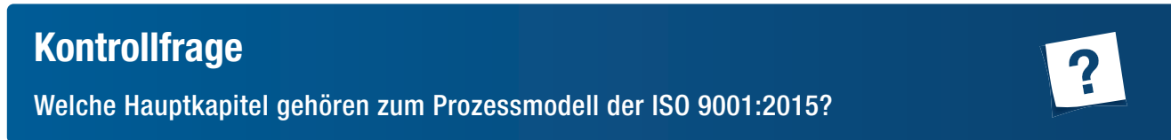
Abb. 4: Zusammenfassung Schwerpunkte ISO 9001:2015