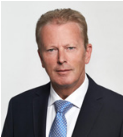
Dr. Reinhold Mitterlehner Vizekanzler und Bundesminister für Wissenschaft, Forschung und Wirtschaft

Damit sorgt der TÜV AUSTRIA nicht nur für mehr Maschinensicherheit, sondern auch für mehr Qualität und einen wettbewerbsfähigen Wirtschaftsstandort. In diesem Sinne wünsche ich eine aufschlussreiche Lektüre des neuen Praxishandbuchs.