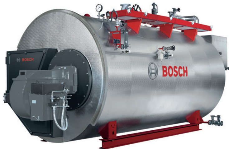
Dampfkessel (Bosch Industriekessel GmbH)

zu erzeugen. Zum Dampfkessel zählen auch im Rauchgasstrom liegende Überhitzer, Rückkühler sowie deren Ausrüstung.