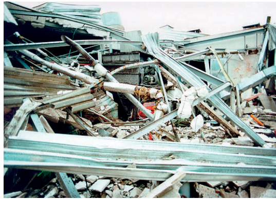
Schäden durch Kesselexplosionen (ORF Steiermark, 2012; FF Pinkafeld, 1996)