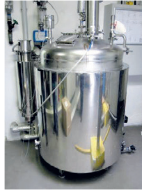
Druckbehälter (TÜV AUSTRIA)

Rohrleitungen: im Sinne der Richtlinie 2014/68/EU zur Durchleitung von Fluiden bestimmte Leitungsbauteile, die für den Einbau in ein Drucksystem miteinander verbunden sind. Zu Rohrleitungen zählen insbesondere Rohre oder Rohrsysteme, Rohrformteile, Fittings, Ausdehnungsstücke, Schlauchleitungen oder ggf. andere druckhaltende Teile.