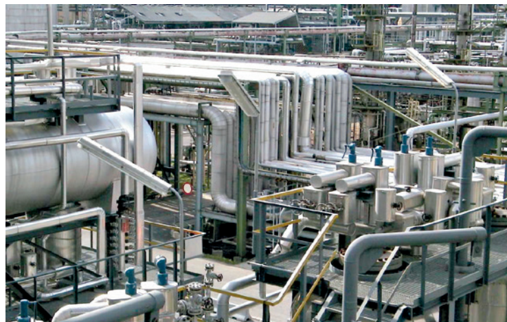
Rohrleitungen (TÜV AUSTRIA)

Rohrleitungen: im Sinne der Richtlinie 2014/68/EU zur Durchleitung von Fluiden bestimmte Leitungsbauteile, die für den Einbau in ein Drucksystem miteinander verbunden sind. Zu Rohrleitungen zählen insbesondere Rohre oder Rohrsysteme, Rohrformteile, Fittings, Ausdehnungsstücke, Schlauchleitungen oder ggf. andere druckhaltende Teile.