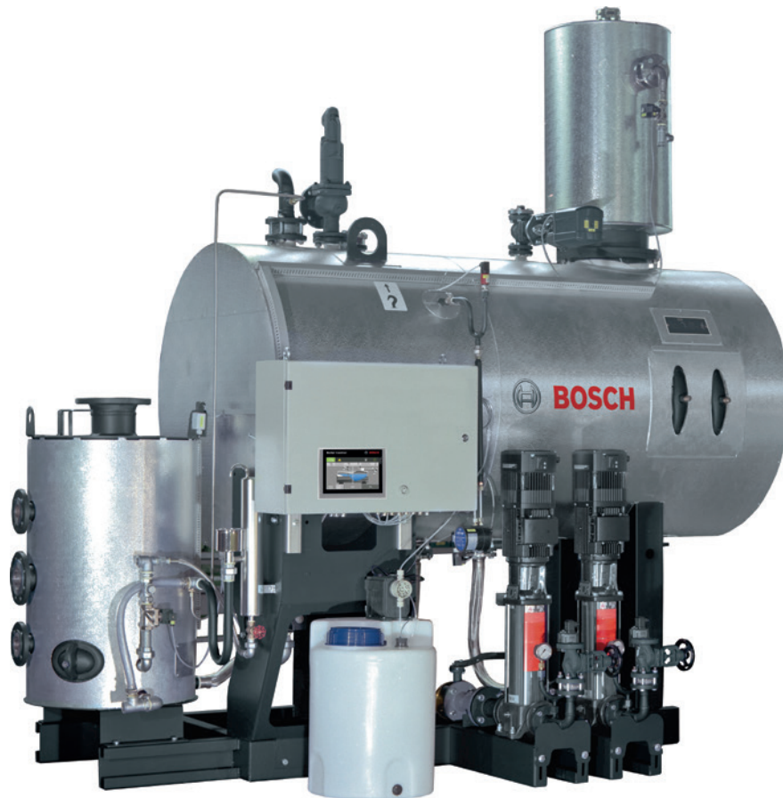
Baugruppe (Bosch Industriekessel GmbH)